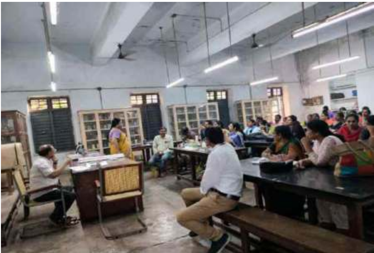
NSS unit organised Martyr's day and the Department of Zoology organised World Leprosy day